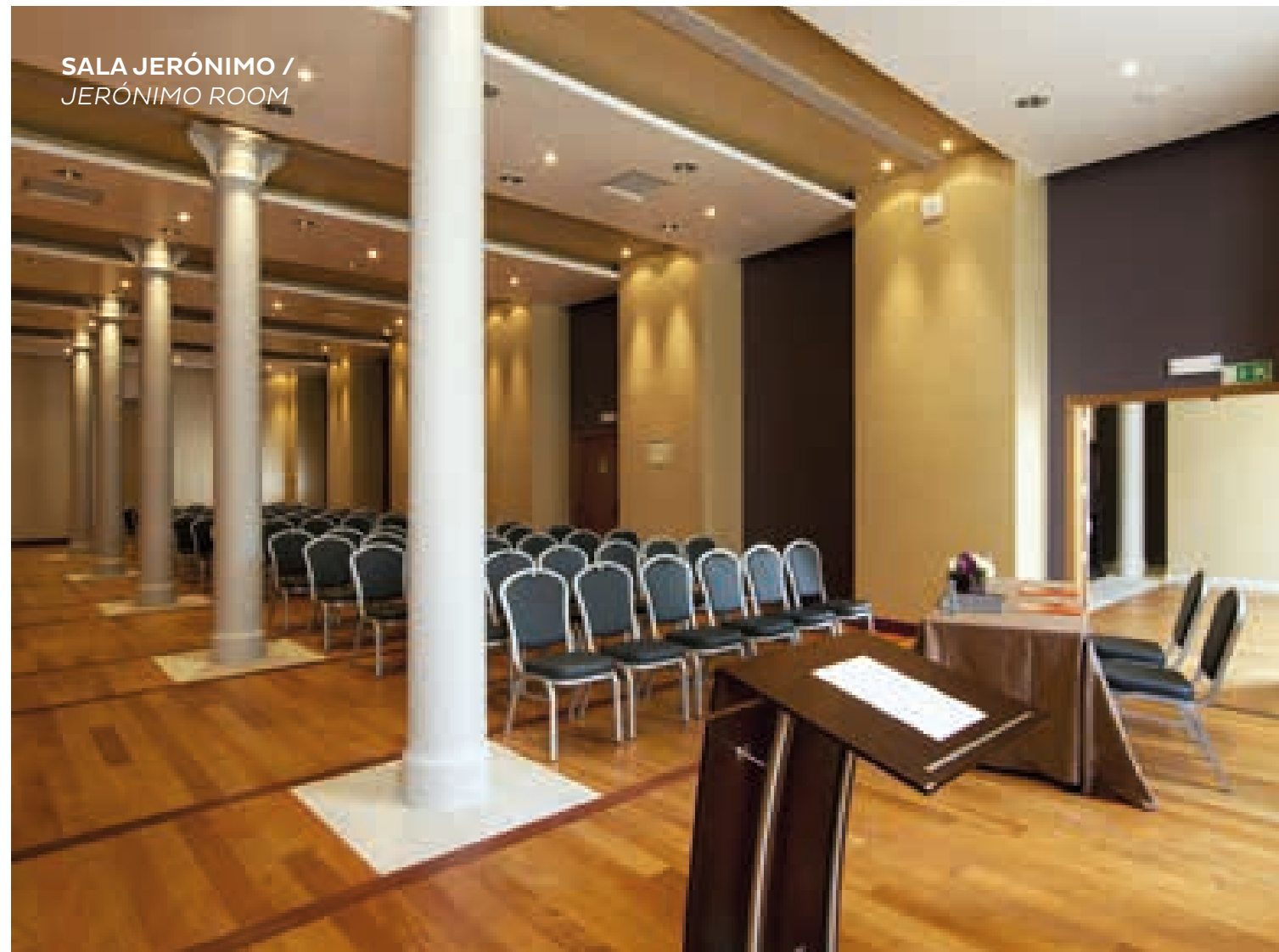
SALA JERÓNIMO / JERÓNIMO ROOM