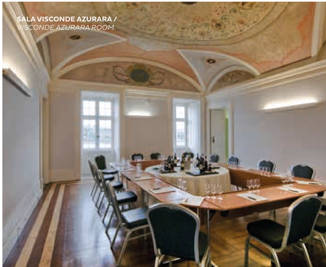
SALA VISCONDE AZURARA / VISCONDE AZURARA ROOM