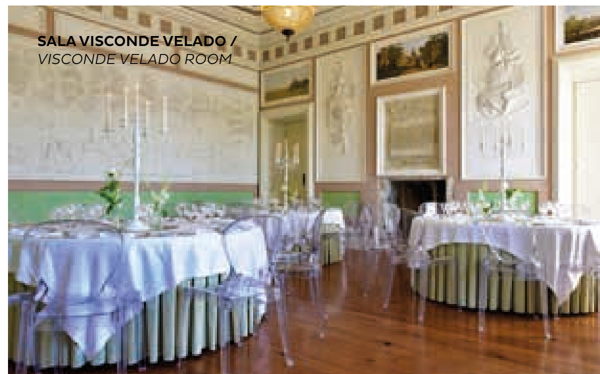
SALA VISCONDE VELADO / VISCONDE VELADO ROOM