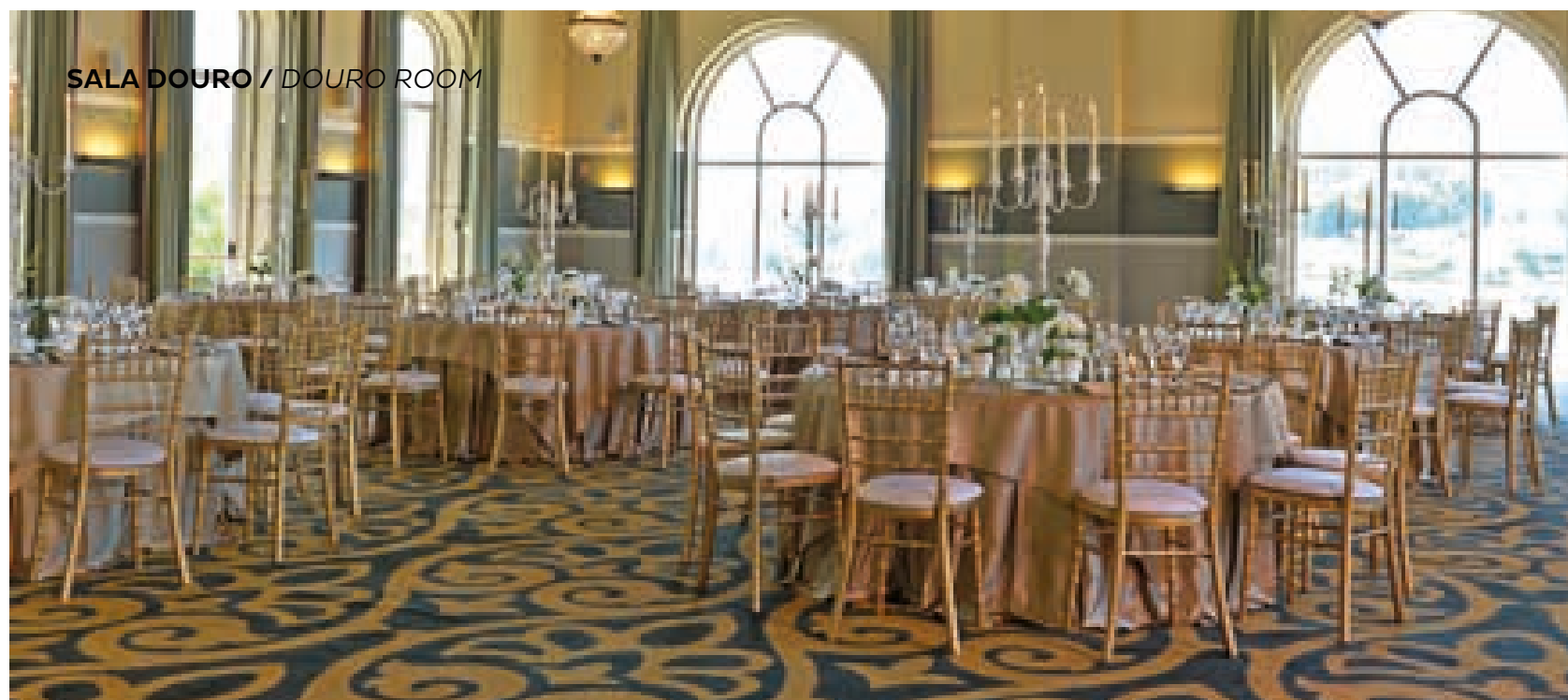
SALA DOURO / DOURO ROOM